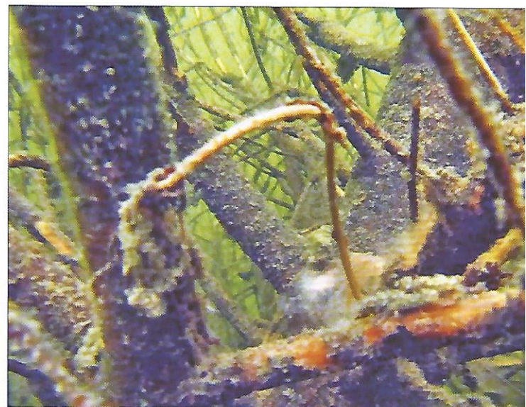
Plankton und Mikroorganismen haben sich schon nach kurzer Zeit auf dem vom BVO eingebrachten Totholz angesiedelt