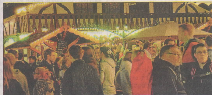
Der Marktplatz war am Montagabend noch einmal gut besucht.